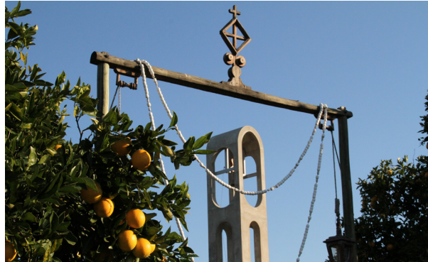
Centro Mariano de Aurora, Paysandú, Uruguai