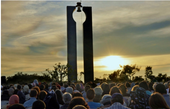
Encontro de Oração no Centro Mariano de Figueira, MG, Brasil