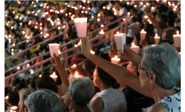
Aparição em Rio Preto, SP, Brasil

“ M aria Santíssima, a Mãe de Jesus, vem se manifestando ao longo da história, por meio de aparições a diferentes videntes, para comunicar Suas mensagens. Há séculos, as aparições da Virgem são testemunhadas por videntes nas mais diferentes partes do mundo, algumas delas envolvidas em fenômenos de toda natureza e curas milagrosas. As aparições de Lourdes (França), as de Fátima (Portugal), as de Boraing e Banneaux (Bélgica), as de Garabandal (Espanha), as de Zeitun (Egito), as de Akita (Japão), as de Medjugorje (Bósnia Herzegovina) tornaram esses lugares focos de atenção de milhares de pessoas.