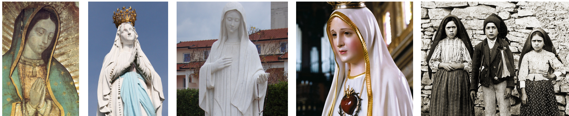
Virgem de Guadalupe, Virgem de Lourdes, Medjugorje, Nossa Senhora de Fátima e os Pastorinhos de Fátima